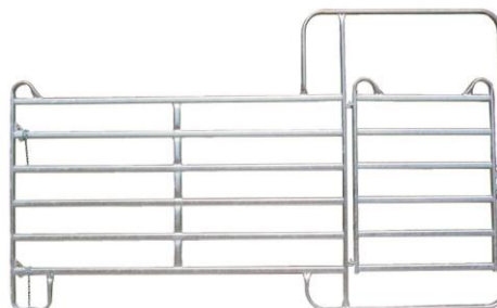
Élément du panel avec portillon Pannelement mit Zugangstüre